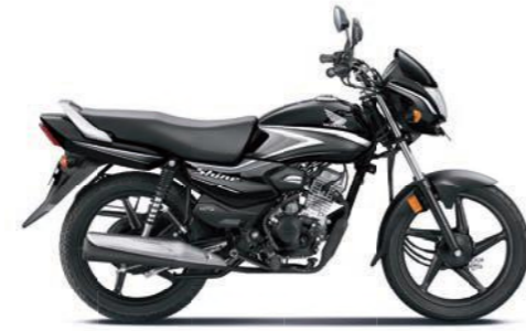
ग्रे के साथ ब्लैक

अभी ऑनलाइन बुक करें! www.honda2wheelersindia.com